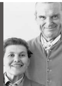
Charles and Ray Eames (1907-1978; 1912-1988)

Un'unica entità indivisibile difficile da trattare separatamente, qualcosa di più di un semplice sodalizio personale e creativo: Charles e Ray Eames hanno contribuito a dare forma al ventesimo secolo americano, in un momento di forte crescita della West Coast, segnata dallo spostamento dell'economia dalla produzione di beni di consumo a quella delle informazioni.